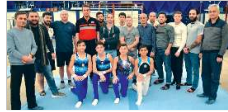
FIG-in məşqçilik kurslarının nəticələri açıqlanıb

Azərbaycan Gimnastika Federasiyasının yerli məşqçilər üçün təşkil etdiyi və Beynəlxalq Gimnastika Federasiyası (FIG) Akademiyası tərəfindən