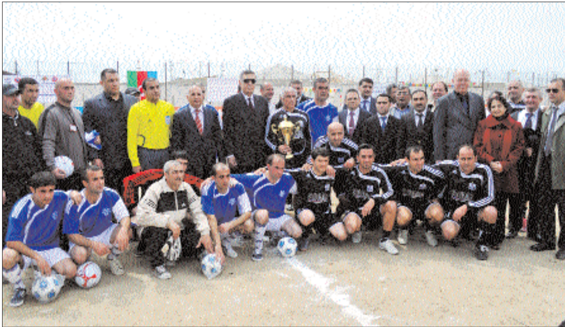
(əvvəli 4-cü səhifədə)