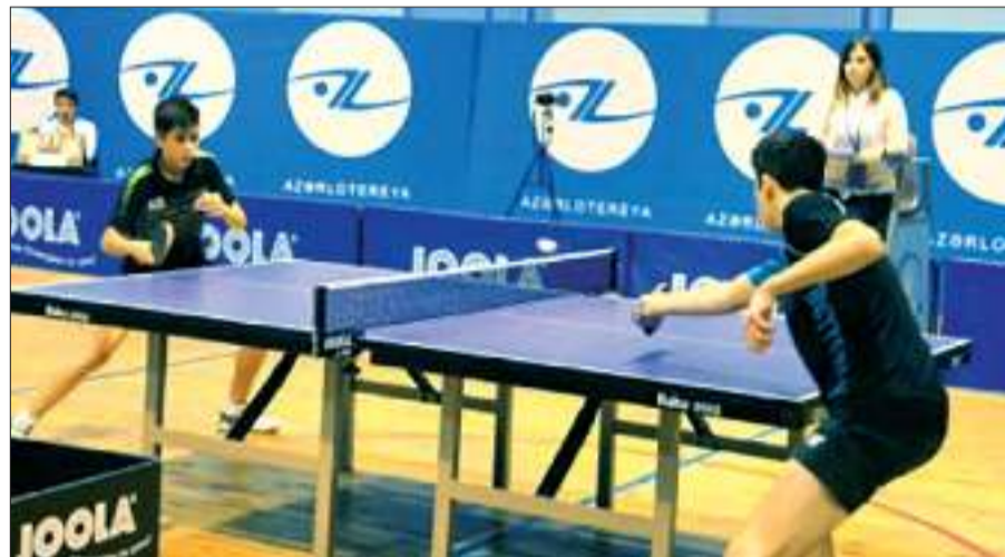
Qeyd edək ki, pilot layihə olan inkişaf etdirilməsi məqsədilə liqa çempionatı klub sisteminin təşkil edilib.

Azərbaycan Stolüstü Tennis Federasiyasının (ASTF) təşkilatçılığı ilə fevralın 9-da klub və həvəskar komandalar arasında liqa çempionatı keçirilib. Liqa çempionatının birinci mərhələsində 13 komanda mübarizə aparıb. Liqa yarışları dairəvi sistem üzrə keçirilib.